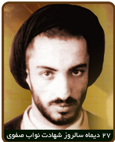
۲۷ دیماه سالروز شهادت نواب صفوی

«فتحی یکن» رهبر سابق جماعت اسلامی لبنان می گوید: «یک شب در هتل قلعه در بیت المقدس، تا صبح پای صحبت های نواب نشستیم. همه سرپا به سخنان او گوش می کردیم. در همین هنگام که صدای نواب، گاه بلند و گاه آهسته به گوش می رسید، ناگهان بانگ الله اکبر مؤذن در فضا طنین انداخت. گویی تمام اعضای بدن نواب تکان خورد. سپس آرام گرفت و سر به پایین انداخت و طوری در خود فرو رفت که هرگز نظیر آن را ندیده بودم. او با جان و دل، گفته های مؤذن را تکرار می کرد. گویی از دنیای دیگری بازگشته است. به چهره اش نگاه کردم، اشک از چشمانش سرازیر شده بود. پرسیدم: «نواب! چه شده است؟» او در حالی که همچنان حالت بکا داشت، گفت: «ای برادر! به خدا سوگند، هر وقت صدای الله اکبر مؤذن به گوشم می رسد، احساس می کنم دنیا در جلو چشمانم آن چنان رنگ می بازد و بی ارزش می شود که گویی یک پشه کوچک است که می توانم آن را زیر پا له کنم و به راهم ادامه دهم. دیگر جز قدرت و عظمت خداوند چیزی را نمی بینم و حس نمی کنم.»